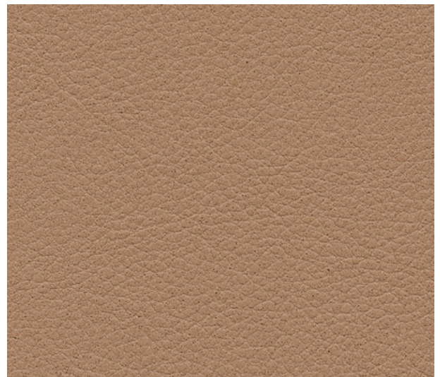
latte macchiato F7901038

Keine Urmuster hinsichtlich Farbe und Qualität. Aufgrund der natürlichen Farbgebung von Kaffee ist eine chargenreine Verarbeitung empfohlen. Abweichungen im Farbausfall sind möglich. | No counter samples regarding to colour and quality. Due to the natural coloring of coffee, batch-pure processing is recommended. Deviations in color appearance are possible. | No constituye una muestra de referencia en cuanto a color y calidad. Debido a la coloración natural del café, se recomienda la elaboración por lotes. Son posibles variaciones en el aspecto del color.