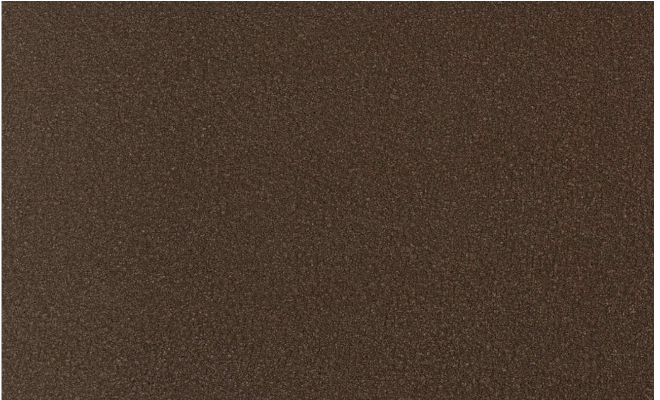
skai® VyP Coffee dark roast F7901036

Un tejido de tapicería transpirable basado en plantas. Para la producción de este material especial se utilizan componentes reciclados y naturales. Sin embargo, lo revolucionario del proceso es que Continental ha conseguido incorporar posos de café a la producción.